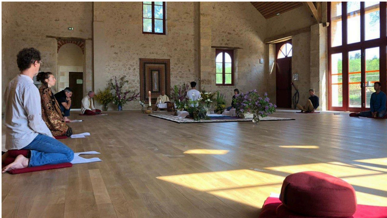
PHOTO A moment of prayer at the Bonnevaux community of the WCCM