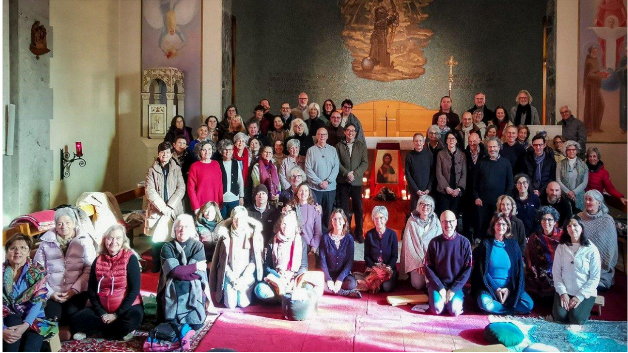
PHOTO: A meeting of the National Council of WCCM Italy